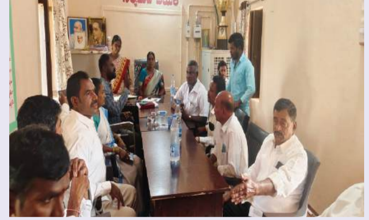
శివపేట, ఏప్రిల్ 29 హిందూస్థాన్ మీడియా