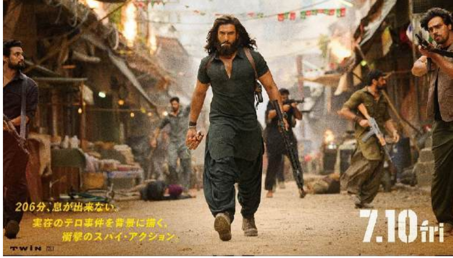
206分、息が出来ない。実存の子口事件を背景に描く、衝撃のハイ・アクション。7.10 in

బాలీవుడ్ స్టార్ హీరో రణవీర్ సింగ్ నటించిన భాక్ బస్టర్ చిత్రం 'ధురంధర్' (పార్ట్ 1) ఇప్పుడు జపాన్లో సందడి చేసేందుకు సిద్ధమైంది. ప్రపంచవ్యాప్తంగా బాక్సాఫీస్ రికార్డులను తిరగరాసిన ఈ పై యాక్షన్ థ్రిల్లర్, జూలై 10న జపాన్లోని థియేటర్లలో విడుదల కానుంది. ఈ విషయాన్ని నిర్మాణ సంస్థలైన జియో స్టూడియోస్, టీ62 స్టూడియోస్ తమ అధికారిక ఇన్స్టాగ్రామ్ ఖాతాల ద్వారా ప్రకటించాయి. జపనీస్ భాషలో వివరాలతో కూడిన పోస్టర్ను కూడా విడుదల చేశాయి. "ఇక జపాన్ 'ధురంధర్' ఎనర్జీని చూసే సమయం వచ్చింది" అంటూ క్యాషన్ జోడించాయి. 2025 డిసెంబర్ 5న ప్రపంచవ్యాప్తంగా విడుదలైన ఈ చిత్రం, అప్పట్లో ఏకంగా రూ. 1328 కోట్లకు పైగా వసూళ్లు సాధించి సంచలనం సృష్టించింది. ముఖ్యంగా అంతర్జాతీయ మార్కెట్లో ఈ సినిమా అద్భుతమైన ప్రదర్శన కనబరిచింది. నార్త్ అమెరికాలో ఆల్ టైమ్ సెంబర్ 1 హిందీ చిత్రంగా నిలవడమే కాకుండా కెనడా, ఆస్ట్రేలియాలో అత్యధిక వసూళ్లు సాధించిన భారతీయ సినిమాగా చరిత్రకెక్కింది. యూకేలో కూడా అత్యుత్తమ ప్రదర్శన కనబరిచిన చిత్రాల్లో ఒకటిగా నిలిచింది. ఆదిత్య ధర్ రచన, దర్శకత్వం, నిర్మాణంలో ఈ సినిమా తెరకెక్కింది. 'ధురంధర్' రెండు భాగాలుగా వస్తున్న చిత్రం. మొదటి భాగంలో, భారతదేశాన్ని లక్ష్యంగా చేసుకున్న ఉగ్రవాద నెట్వర్క్ను ఛేదించడానికి పాకిస్థాన్లోని కరాచీకి వెళ్లిన ఒక అండర్ కవర్ భారతీయ ఇంటెలిజెన్స్ ఏజెంట్ కథను చూపించారు. దక్షిణాసియాలోని పలు వాస్తవ భౌగోళిక, రాజకీయ సంఘటనల స్ఫూర్తితో ఈ సినిమా కథను రూపొందించారు. ఈ చిత్రంలో రణవీర్ సింగ్తో పాటు అక్షయ్ ఖన్నా, సంజయ్ దత్, అర్జున్ రాంపాల్, ఆర్. మాధవన్ వంటి ప్రముఖ తారలు నటించారు. ప్రపంచవ్యాప్తంగా ఘన విజయం సాధించిన ఈ చిత్రం, జపాన్లో ఎలాంటి స్పందన రాబట్టుకుంటుందోనని సిని వర్గాల్లో ఆసక్తి నెలకొంది.