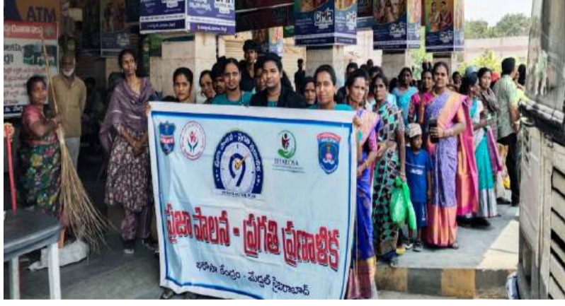
మేడ్చల్, ఏప్రిల్ 29 హిందూస్థాన్ మీడియా

ప్రజాపాలన-ప్రగతి ప్రణాళికలో భాగంగా మేడ్చల్ భరోసా టీమ్ అధ్యక్షులలో బుధవారం మూడు అవగాహన కార్యక్రమాలు విజయవంతంగా నిర్వహించడం జరిగిందని తెలిపారు. సమాజంలో పెరుగుతున్న సామాజిక సమస్యలపై ప్రజలకు చైతన్యం కల్పించడం లక్ష్యంగా ఈ కార్యక్రమాలు చేపట్టడం జరిగిందని, మొదటి కార్యక్రమం మేడ్చల్లోని జిహెచ్ఎంసీ కార్యాలయంలో నిర్వహించగా, రెండవది మేడ్చల్ బస్ స్టాండ్ వద్ద, మూడవది ట్రైల్ బ్లెజర్స్ జాస్మిన్ హోమ్లో నిర్వహించామని తెలిపారు. ఈ మూడు కార్యక్రమాలకు కలిపి మొత్తం 278 మంది హాజరయ్యారని అన్నారు. ఈ సందర్భంగా భరోసా టీమ్ సభ్యులు మాట్లాడుతూ... పితృస్వామ్య వ్యవస్థ, మహిళలపై ద్వేష భావన, మానవ అక్రమ రవాణా,