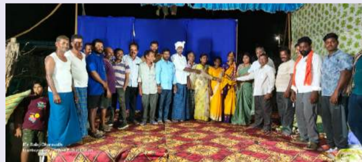
కారేపల్లి, ఏప్రిల్ 29 హిందుస్థాన్ మీడియా