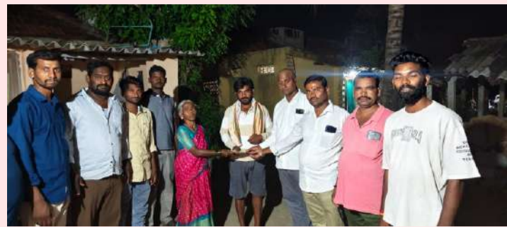
శివపేట, ఏప్రిల్ 30 హిందూస్థాన్ మీడియా