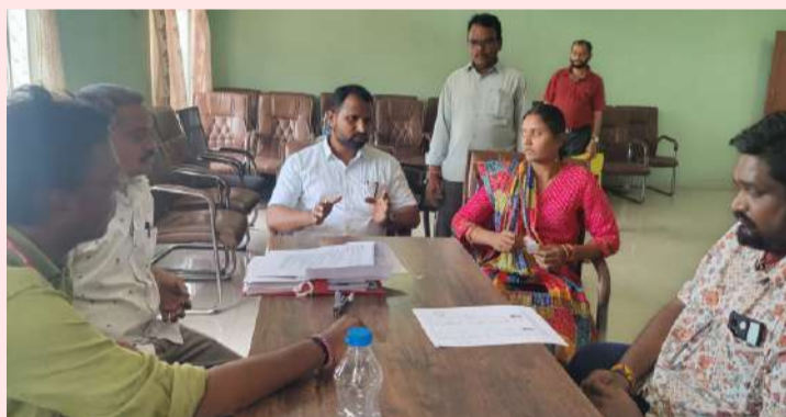
బెల్లంపల్లి, ఏప్రిల్ 30 హిందూస్థాన్ మీడియా