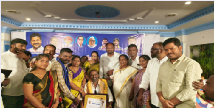
మే 01 హిందుస్థాన్ మీడియా