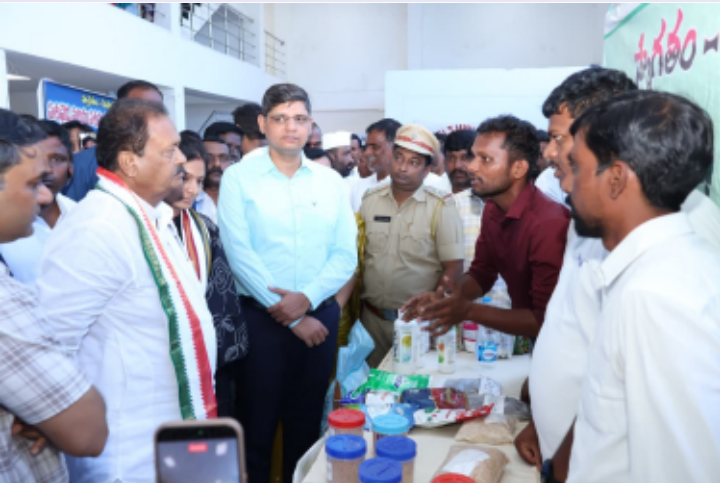
కామారెడ్డి, మే02 హిందూస్థాన్ మీడియా