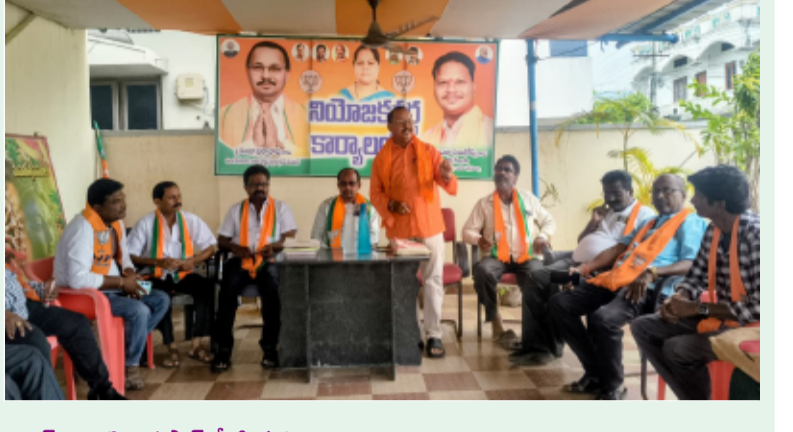
జూన్ 14 (హిందుస్థాన్ మీడియా)