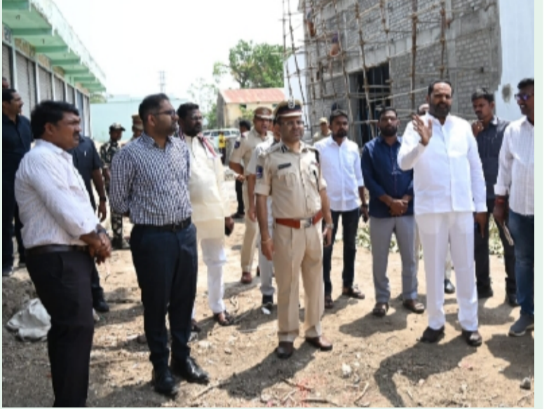
జూన్ 14 (హిందుస్థాన్ మీడియా)

-పోలీస్ స్టేషన్ నిర్మాణానికి అనువైన స్థలాలపై సమగ్ర నివేదిక సమర్పించాలని అధికారులకు ఆదేశం