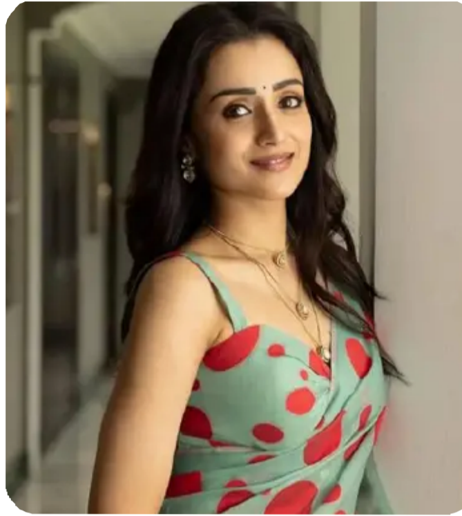
సాత్ ఇండియన్ స్టార్ హీరోయిన్ త్రిష గురించి చేసుకునేందుకు.. ఏకంగా 12 ఏళ్లుగా ల్యాబ్ కే