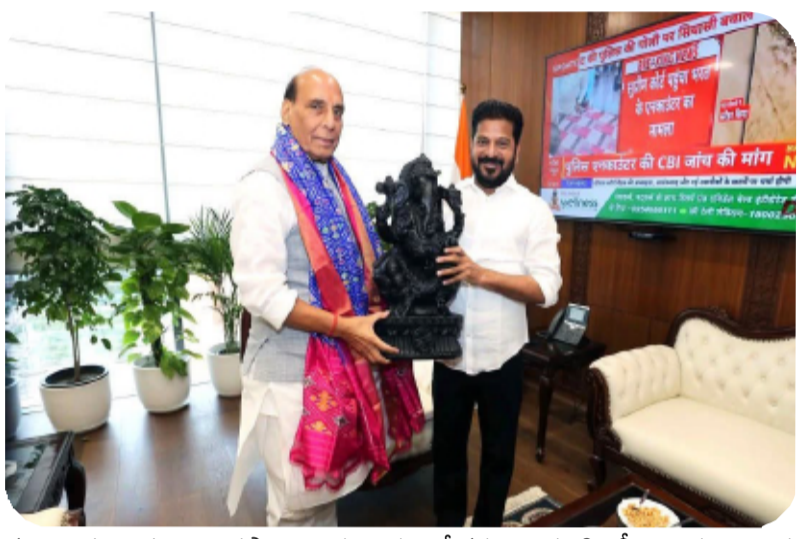
కూడా ముఖ్యమంత్రి ప్రస్తావించారు. భూ సేకరణ, యుటిలిటీల బదలాయించు తదితర అంశాల్లో రాష్ట్ర ప్రభుత్వం పూర్తి సహకారం అందిస్తుందని కేంద్ర మంత్రికి హామీ ఇచ్చారు. దేశ భద్రత, రక్షణకు సంబంధించిన ప్రాజెక్టు కావడంతో రాష్ట్రం

హిందుస్థాన్ మీడియా న్యూఢిల్లీ పర్యటనలో భాగంగా తెలంగాణ ముఖ్యమంత్రి రేవంత్ రెడ్డి కేంద్ర రక్షణ శాఖ మంత్రి రాజ్ నాథ్ సింగ్ తో కీలక సమావేశమయ్యారు. ఈ సందర్భంగా రాష్ట్రానికి సంబంధించిన పలు కీలక ప్రాజెక్టులపై ఇరువురు నేతలు విస్తృతంగా చర్చించారు. గాంధీ సరోవర్ ప్రాజెక్టు కోసం రక్షణ శాఖకు చెందిన భూములను రాష్ట్ర ప్రభుత్వానికి బదలాయించినందుకు సీఎం రేవంత్ రెడ్డి కేంద్ర మంత్రి రాజ్ నాథ్ సింగ్ కు ప్రత్యేకంగా కృతజ్ఞతలు తెలిపారు. తెలంగాణ అభివృద్ధికి కేంద్ర ప్రభుత్వం అందిస్తున్న సహకారాన్ని ఈ సందర్భంగా ఆయన అభినందించారు. న్యూఢిల్లీ పర్యటనలో భాగంగా తెలంగాణ ముఖ్యమంత్రి రేవంత్ రెడ్డి కేంద్ర రక్షణ శాఖ మంత్రి రాజ్ నాథ్ సింగ్ తో కీలక సమావేశమయ్యారు. ఈ సందర్భంగా రాష్ట్రానికి సంబంధించిన పలు కీలక ప్రాజెక్టులపై ఇరువురు నేతలు విస్తృతంగా చర్చించారు. గాంధీ సరోవర్ ప్రాజెక్టు కోసం రక్షణ శాఖకు చెందిన భూములను రాష్ట్ర ప్రభుత్వానికి బదలాయించినందుకు సీఎం రేవంత్ రెడ్డి కేంద్ర మంత్రి రాజ్ నాథ్ సింగ్ కు ప్రత్యేకంగా కృతజ్ఞతలు తెలిపారు. తెలంగాణ అభివృద్ధికి కేంద్ర ప్రభుత్వం అందిస్తున్న సహకారాన్ని ఈ సందర్భంగా ఆయన అభినందించారు. అలాగే రాష్ట్ర ప్రభుత్వం అత్యంత ప్రతిష్టాత్మకంగా భావిస్తున్న ఆదిలాబాద్ ఎయిర్ ఫోర్స్ అభివృద్ధి అంశాన్ని