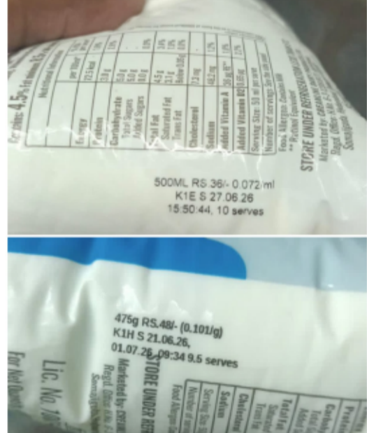
ఈ నెల 25వ తేదీన చేర్యాల మార్కెట్ లో ఒక షాప్ లో పాల పెరుగు ప్యాకెట్లకు 94 రూపాయలు తీసుకున్నవైనం (MRP 84)

?అధికారుల పరిస్థితి ఇలా ఉంటే, స్థానిక మున్సిపల్