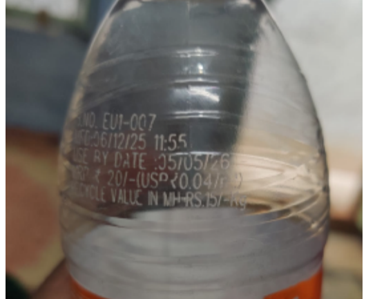
ఒక షాపులో Expiry అయిన కూల్ డ్రింక్ల బిల్లు