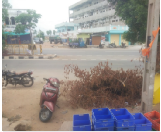
చేర్యాలలో షాపుల ముందు చెల్ల కుప్పలు

-ఎమ్మార్పీ (MRP) ఉల్లంఘన.. లిఅడిగితేనే ఒక న్యాయం.. అడగకుంటే మరో న్యాయమా? గత కొన్ని రోజులుగా చేర్యాల పట్టణంలో ఎమ్మార్పీ ధరల ఉల్లంఘన విపరీతంగా పెరిగిపోయింది. దీనిపై స్థానిక వినియోగదారులు నెత్తికోరూ బాదుకుంటున్నా ఇటు మున్సిపల్ సిబ్బంది గానీ, అటు ఫుడ్ సేఫ్టీ అధికారులు గానీ పట్టించుకున్న పాపాన పోలేదు. పాల ప్యాకెట్ల డోపిడీ: ప్రతి నిత్యం ప్రతి ఇంటా వాడే పాల ప్యాకెట్లపై కనీసం మూడు నుండి ఐదు రూపాయలు అదనంగా వసూలు చేస్తున్నారు. ఇటీవల ఒక షాపులో ఓ వినియోగదారుడు పాల ప్యాకెట్లకు మూడు రూపాయలు ఎక్కువ తీసుకోవడంపై నిలదీసి ప్రశ్నించడంతో.. నదరు దుకాణదారుడు అప్పటినుండి ఎమ్మార్పీ ధరకే ఇస్తున్నాడు. కానీ మిగతా షాపుల వారు మాత్రం 'మాకేంటి భయం' అన్నట్లు అందరి వద్ద యథేచ్ఛగా అధిక ధరలకే విక్రయిస్తూ వగటి దొంగతనానికి పాల్పడుతున్నారు. కూల్ డ్రింక్స్ ౧ వాటర్ బాటిల్స్: ఎండ తీవ్రతను బట్టి కూల్ డ్రింక్స్,