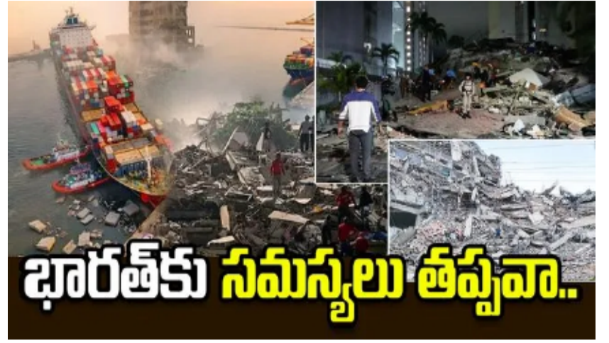
భారత్కు సమస్యలు తప్పవా..

వెనెజువెలాలో ఇటీవల సంభవించిన రెండు భారీ భూకంపాలు అక్కడి ప్రజల జీవితాలను అతలాకుతలం చేశాయి. ఒక్క నిమిషం వ్యవధిలో రెండు తీవ్ర భూకంపాలు రావడంతో భారీ ఆస్తి, ప్రాణ నష్టాలు సంభవించాయి. ఈ భూకంపాల ప్రభావం వెనెజువెలాకు 14 వేల కిలోమీటర్ల దూరంలో ఉన్న భారత్పై కూడా తీవ్రంగా పడనుందని నిపుణులు ఆందోళన వ్యక్తం చేస్తున్నారని ఇటీవలి కాలంలో వెనెజువెలా నుంచి భారత్ చమురు దిగుమతులను గణనీయంగా పెంచింది. పశ్చిమాసియాలో నెలకొన్న అనిశ్చితి నేపథ్యంలో భారత చమురు శుద్ధి సంస్థలు ఇటీవల వెనెజువెలా నుంచి ముడి చమురు కొనుగోళ్లను పెంచాయి. ఏప్రిల్, మే నెలల్లో భారత్కు వెనెజువెలా చమురు సరఫరాదారుల్లో ఒకటిగా వెనెజువెలా ఎదిగింది. ఈ పరిస్థితుల్లో భూకంపం వల్ల అక్కడి ఎగుమతి వ్యవస్థకు అంతరాయం కలిగితే భారత్పై కూడా ప్రభావం పడే అవకాశం ఉందని నిపుణులు అంచనా ఉందని చెబుతున్నారు.