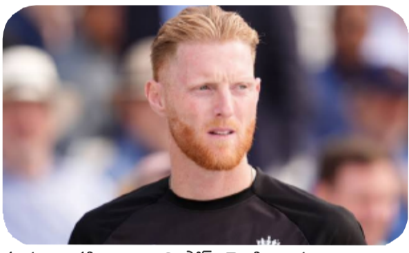
కఠినంగా గడిచాయి' అని స్టోక్స్ వెల్లడించాడు. జట్టుకు మేలు జరుగుతుంది.. నైట్ క్రీజ్ వివాదం తర్వాత న్యూజిలాండ్ తో రెండో టెస్టుకు స్టోక్స్ పై వేటు వడిన సంగతి తెలిసిందే. ఆ సమయంలో అతడు కౌంటీ జట్టు డర్బమ్ తరఫున ఆడాడు. 'అక్కడ క్రికెట్ ను ఆస్వాదించగలిగాను. కానీ అంతర్జాతీయ స్థాయికి తిరిగి వచ్చిన తర్వాత ఆ అనుభూతిని పొందలేకపోయాను. అయితే నా రిటైర్మెంట్ నిర్ణయంలో కొంత నా స్వార్థం కూడా ఉంది. భవిష్యత్తులో జట్టుకు ఇది మేలు చేస్తుందని ఆశిస్తున్నా. నా జీవితంలో ఎంతో ఇచ్చిన క్రికెట్ పై ప్రేమ కోల్పోకుండా ఉండాలంటే రిటైర్మెంట్ ఇచ్చేందుకు ఇదే సరైన సమయమని భావించా' అని స్టోక్స్ తెలిపాడు.

ఇంటర్నేట్ డెస్క్: ఇంగ్లండ్ టెస్టు కెప్టెన్ బెన్ స్టోక్స్ అంతర్జాతీయ క్రికెట్ కు వీడ్కోలు పలికిన సంగతి తెలిసిందే. న్యూజిలాండ్ తో జరుగుతున్న మూడో టెస్టు అతడి కెరీర్ లో చివరిదని వెల్లడించాడు. అయితే స్టోక్స్ అనూహ్యంగా ఈ నిర్ణయం తీసుకోవడంపై అభిమానులు అనుమానాలు వ్యక్తం చేస్తున్నారు. నైట్ క్రీజ్ వివాదం నేపథ్యంలో ఇంగ్లండ్ క్రికెట్ బోర్డు రిటైర్మెంట్ ప్రకటించాలని స్టోక్స్ పై ఒత్తిడి తెచ్చిందని నెట్టింట్ వార్తలు చక్కర్లు కొడుతున్నాయి. ఈ క్రమంలో ఆ వార్తలపై స్టోక్స్ స్పందించాడు. ఇది పూర్తిగా తన వ్యక్తిగత నిర్ణయమని.. ఎవరూ తనను రిటైర్మెంట్ ఇవ్వాలని బలవంతం చేయలేదని స్టోక్స్ స్పష్టం చేశాడు. 'ఈ నిర్ణయం నేను ఒక్కసారిగా తీసుకున్నది కాదు. గతేడాది ఆస్ట్రేలియాలో జరిగిన యూషెస్ సిరీస్ లో ఇంగ్లండ్ 4-1 తేడతో ఓడింది. అప్పటి నుంచే మానసికంగా ఒత్తిడికి గురయ్యాను. తిరిగి కోలుకోవడానికి ఎంతో ప్రయత్నించా. కానీ ఫలితం రాలేదు. నన్ను నేను పూర్తిగా అలసిపోయేలా చేసుకున్నా. నైట్ క్రీజ్ వివాదం నాపై ప్రభావం చూపింది. డ్రెస్సింగ్ రూమ్ లో కూర్చున్న సమయంలో నేను మానసికంగా ఎంతగా అలసిపోయానో అర్థమైంది. నా జీవితంలో ఇలాంటి పరిస్థితులు కొత్తేమీ కాదు. కానీ గత రెండు వారాలు చాలా