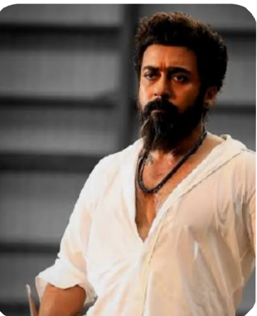
సూర్యతో మా ప్రయాణం.. గర్వంగా ఉంది: హోంబలే ఫిల్మ్స్ "ఇది ఆయన నిర్మించుకున్న కెరీర్. ప్రేమ ప్రేమకూ, సినిమా సినిమాకూ, పైట్

పైట్లకూ తనకంటూ ఓ ప్రత్యేక స్థానాన్ని సృష్టించుకున్నారు. ఎన్నో నిజ జీవితాల బరువును మోసే పాత్రలలో జీవించారు. ఆయన కెరీర్ ప్రతీసారి సౌకర్యాన్ని కాదని, ధైర్యాన్ని ఎంచుకుంది. మూడు దశాబ్దాలుగా తెరపై సత్యాన్ని ఆవిష్కరిస్తూ, తెర వెనుక కోట్లాది హృదయాలను గెలుచుకున్నారు. ఈ తరం అత్యంత నిర్ణయ నటుడు, ఇప్పుడు తన కెరీర్లోనే అత్యంత భారీ వేదికపైకి అడుగుపెడుతున్నారు. అలాంటి నటుడితో సినిమా చేసే అవకాశం మాకు దక్కింది. హోంబలే ఫిల్మ్స్ తరఫున 'ది వన్ - సూర్య'కు మేము గర్వంగా స్వాగతం పలుకుతున్నాము. సూర్య గారితో మా ఈ ప్రయాణం కోసం ఎంతో ఆసక్తిగా ఎదురుచూస్తున్నాం. ఆయన నటన, మా నిర్మాణ విలువలు కలిసి ప్రేక్షకులకు ఒక అద్భుతమైన సినిమాటిక్ అనుభూతిని అందిస్తాయని మనస్ఫూర్తిగా నమ్ముతున్నాము. ఈ భారీ ప్రాజెక్టుకు సంబంధించిన మరిన్ని వివరాలను త్వరలోనే వెల్లడిస్తాం" అని ఆ ప్రకటనలో పేర్కొన్నారు.