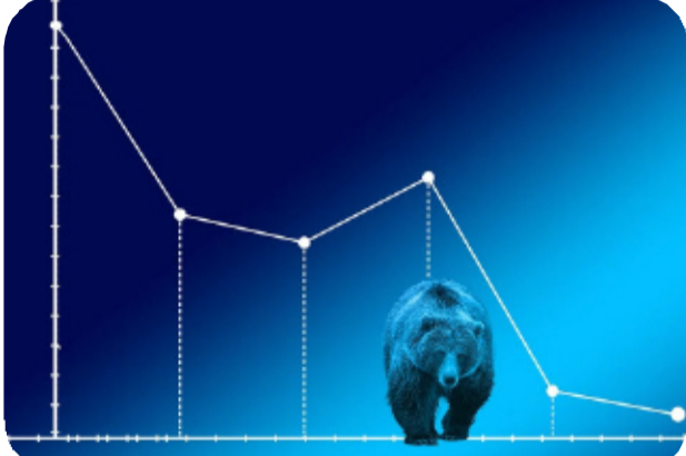
24,100-24,200 స్థాయిల్లో అమ్మకాల ఒత్తిడి ఎదుర్కోవాల్సి ఉంటుంది. ఇక దిగువన 23,900 తక్షణ మద్దతుగా, 23,800 బలమైన మద్దతుగా పనిచేస్తుందని వారు తెలిపారు. ఈరోజు ట్రేడింగ్ లో ఫార్మా, మెటల్, హెల్త్ కేర్ రంగాలు రాణించగా.. ఆటో, కెమికల్, ఆయిల్ అండ్ గ్యాస్ రంగాలు అత్యధికంగా నష్టపోయాయి. బ్రాడర్ మార్కెట్ లోనూ మిడ్ క్యాప్ సూచీ 0.37 శాతం, స్మాల్ క్యాప్ సూచీ 0.62 శాతం మేర నష్టపోయాయి. రాబోయే రోజుల్లో పశ్చిమాసియా పరిణామాలు, ఇతర అంతర్జాతీయ సంకేతాలు మార్కెట్ గమనాన్ని నిర్దేశిస్తాయని విశ్లేషకులు భావిస్తున్నారు.

-సోమవారం నాటి ట్రేడింగ్ లో స్టాక్ మార్కెట్లకు నష్టాలు -సెన్సెక్స్ 372 పాయింట్లు, నిష్ఠి 109 పాయింట్లు పతనం -పశ్చిమాసియా ఉల్లికత్తలు, ఐటీ, ఆటో రంగాల బలహీనతే ప్రధాన కారణం -ఫార్మా, మెటల్ షేర్లు రాణించగా, ఆటో, ఆయిల్ అండ్ గ్యాస్ షేర్లలో క్షీణత -నిష్ఠికి 23,900 వద్ద మద్దతు, 24,000 వద్ద నిరోధం ఉందని నిపుణుల విశ్లేషణ దేశీయ స్టాక్ మార్కెట్లు సోమవారం నష్టాలతో ముగిశాయి. పశ్చిమాసియాలో మళ్ళీ తలెత్తిన ఉద్రిక్తతల నేపథ్యంలో మరుపరులు అమ్మకాలకు మొగ్గుచూపారు. దీనికి తోడు ఆటో, ఐటీ, ప్రభుత్వ రంగ బ్యాంకింగ్ స్టాక్ లో అమ్మకాల ఒత్తిడి పెరగడంతో సూచీలు భారీగా నష్టపోయాయి. ట్రేడింగ్ ముగిసే సమయానికి, సెన్సెక్స్ 372.10 పాయింట్లు నష్టపోయి 76,728.37 వద్ద స్థిరపడింది. నిష్ఠి 109.75 పాయింట్లు క్షీణించి 23,946.25 వద్ద ముగిసింది. అంతర్జాతీయంగా నెలకొన్న ఆందోళనలతో ట్రేడర్లు రిస్క్ తీసుకోవడానికి వెనుకాడారు. దీంతో దాదాపు అన్ని రంగాల్లోనూ అమ్మకాలు వెల్లువెత్తాయి. ముఖ్యంగా మహింద్రా అండ్ మహింద్రా, టాటా మోటార్స్ షేర్ల ప్రధాన నష్టాల్లో ఉన్నాయి. సాంకేతిక నిపుణుల విశ్లేషణ ప్రకారం, నిష్ఠికి 24,000 కీలక నిరోధంగా మారింది. దీనిని దాటితే