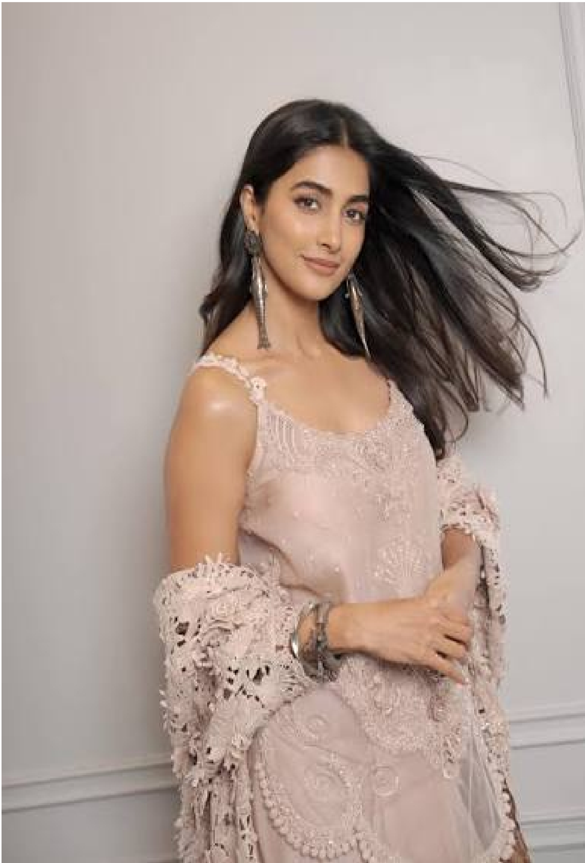
-అవకాశాలు తగ్గి వెనుకబడ్డ పూజా హెగ్డే 'ఓజీ 2'లో పూజా హెగ్డేను ఎంపిక చేసినట్లు సమాచారం -గతంలో పవన్ సరసన ఛాన్స్ మిన అయిన పూజ

బుట్టబొమ్మ పూజా హెగ్డేకి కొంత కాలంగా అవకాశాలు తగ్గిన సంగతి తెలిసిందే. తాజాగా పూజా హెగ్డే బంపర్ ఆఫర్ కొట్టేసినట్లు ఫిలిం నగర్ టాక్. పవర్ స్టార్ పవన్ కల్యాణ్ సరసన ఛాన్స్ కొట్టేసినట్లు వార్తలు వస్తున్నాయి. పవన్, దర్శకుడు సుజిత్ కాంబినేషన్లో వచ్చిన 'ఓజీ' సినిమా సూపర్ హిట్ అయిన సంగతి తెలిసిందే. ఇప్పుడు 'ఓజీ 2' తెరకెక్కబోతోంది. ఈ సినిమాలో పూజా హెగ్డేను తీసుకున్నట్లు ప్రచారం జరుగుతోంది. ఇదే నిజమైతే పూజ లక్ష్మి ఛాన్స్ కొట్టేసినట్టే. గతంలోనే పవన్, పూజా హెగ్డే కాంబినేషన్ సెట్ అవ్వాలింది కానీ... కానీ, డేట్స్ సమస్య కారణంగా ఆగిపోయింది. హారీశ్ శంకర్ 'ఉస్తాద్ భగత్ సింగ్', క్రిష్ జాగర్లమూడి ప్రాజెక్టులో మొదట పూజా పేరు వినపడినా వర్కవుల్ అవ్వలేదు. ఒకవేళ ఇప్పుడు 'ఓజీ 2' వార్త నిజమైతే... వరుస ఫెయిల్యూర్స్ తో సైలెంట్ అయిన పూజా హెగ్డేకు, ఈ మెగా ప్రాజెక్ట్ ఒక స్ట్రాంగ్ కమ్ బ్యాక్ లా మారబోతోంది.